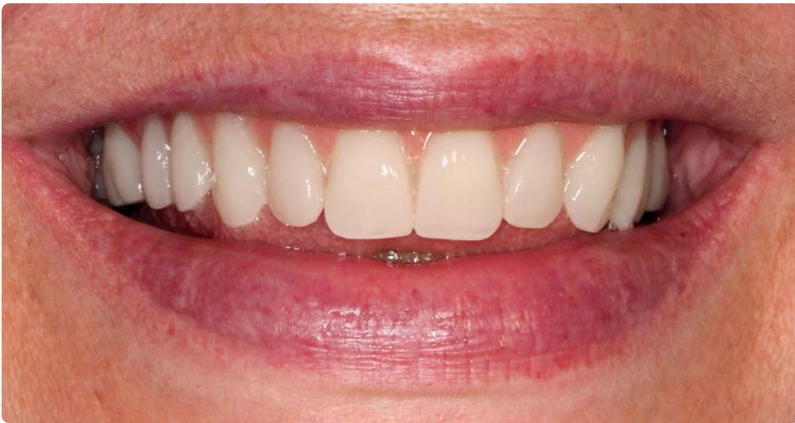
Abb. 19 Der Reisezahnersatz fñgt sich harmonisch ein