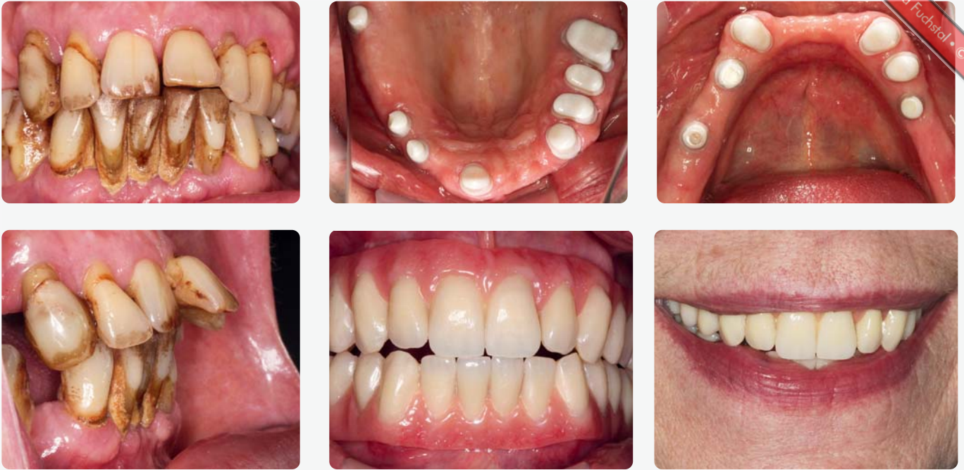
Ober- und Unterkieferrestauration auf Zähnen und Implantaten nach der Sanierung und der Bisshebung