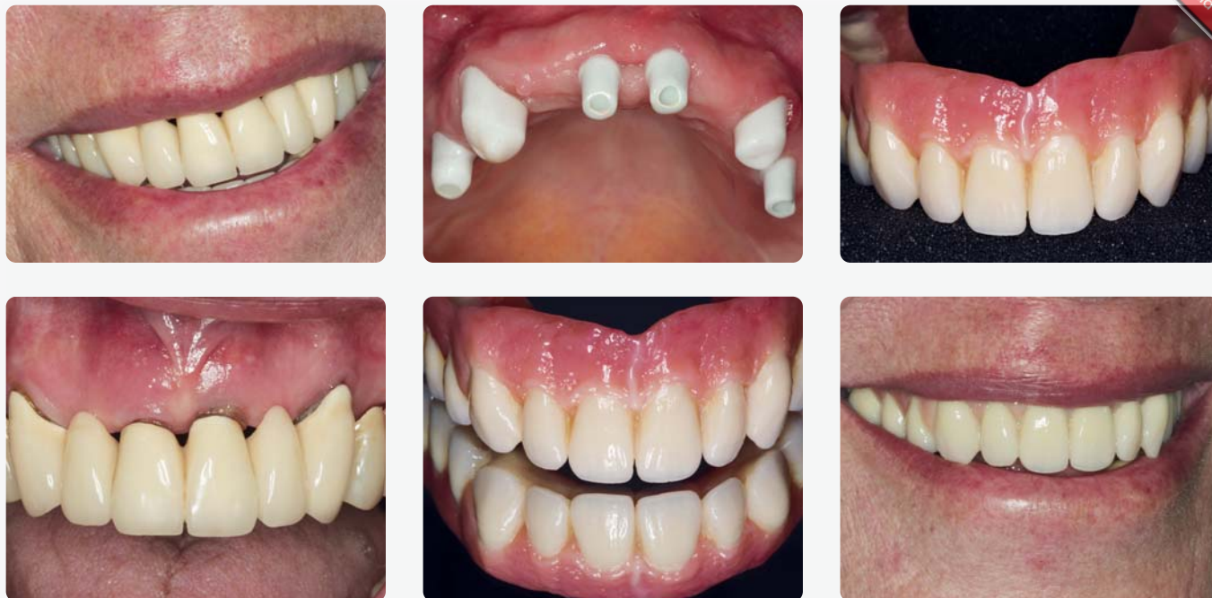
Oberkieferersatz auf zwei Zähnen und vier Implantaten nach Zahnverlust; die Ausgangssituation weist eine kosmetisch ungünstige Lückenbildung auf

höhere Kräfte wirken. Die hohe Zufriedenheit unserer Patienten mit einer Versorgung, die aufwändig herzustellen, sicherlich auch kostenintensiv in der Anfangs-