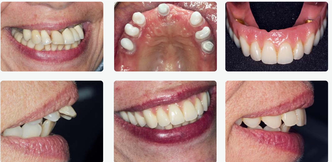
Oberkiefersersatz nach starkem Vertikalverlust durch fehlende posteriore Abstützung; die Ausgangssituation zeigt weit nach vestibulär inklinierte Frontzähne