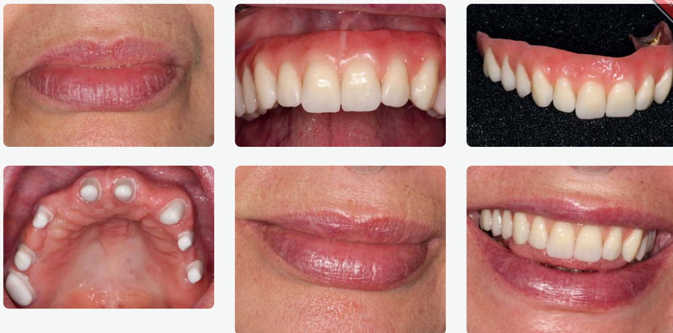
Der Oberkieferersatz auf vier Zähnen und vier Implantaten bewirkt eine deutliche Veränderung der Physiognomie